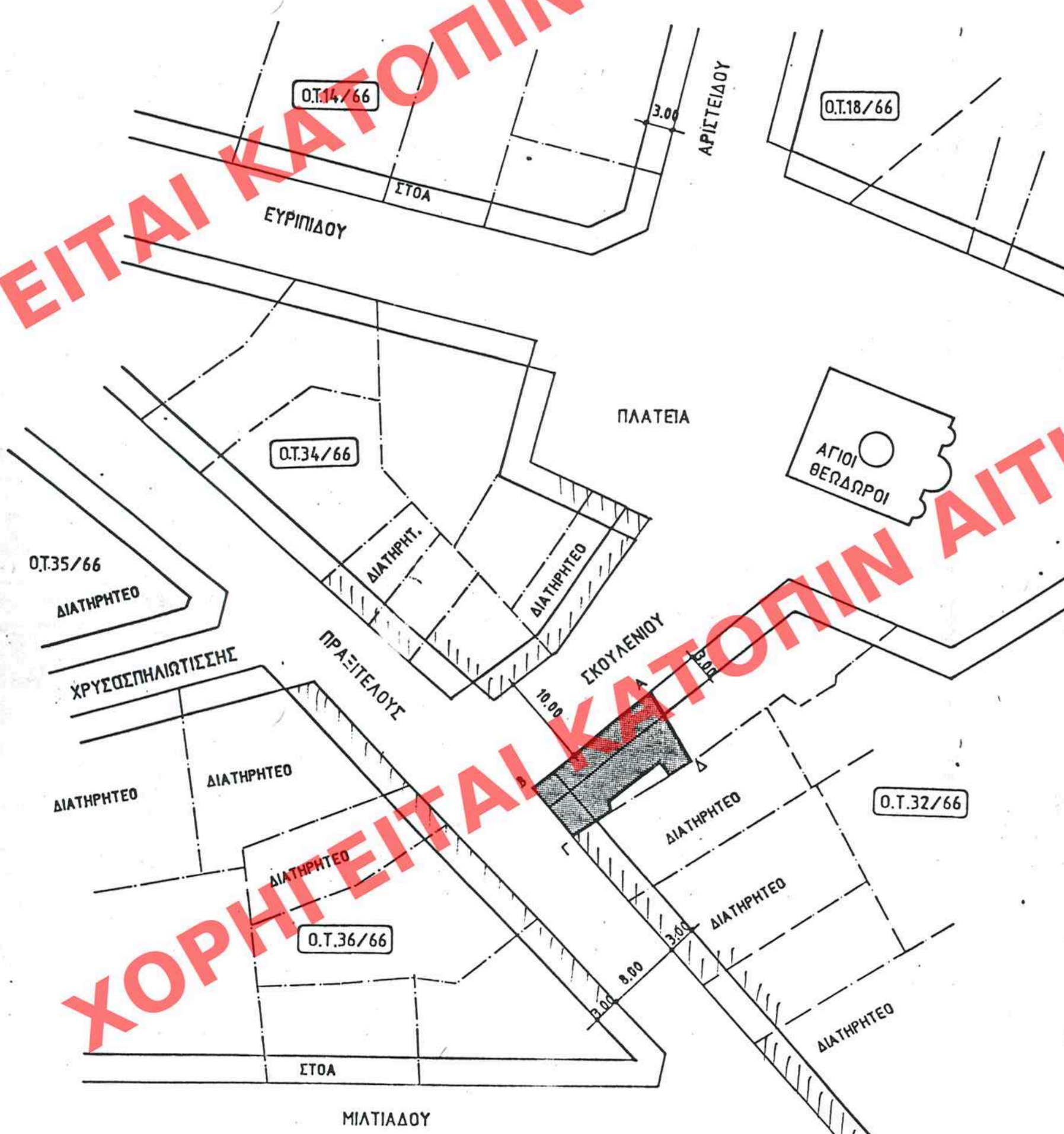
ΤΟΠΟΓΡΑΦΙΚΟ ΚΑ. 1/500

ΥΠΟΥΡΓΕΙΟ ΠΕΡΙΒΑΛΛΟΝΤΟΣ ΧΡΗΣΕΩΣ & ΔΗΜ. ΕΡΓΩΝ